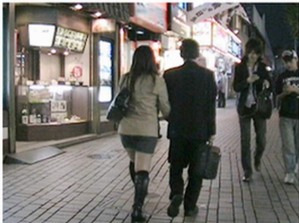
< JR「新宿」駅方面へ向う2人 >