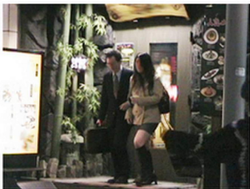
< 居酒屋を退店する2人 >

本人がレジにて会計を済ませ、同店を退店する。 その後、2人は腕を組んで区役所通りを北方向に向う。