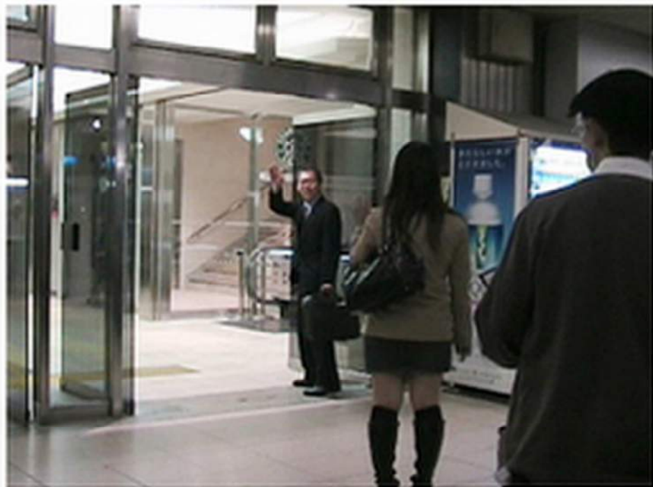
< 別れの挨拶を交わす2人 >