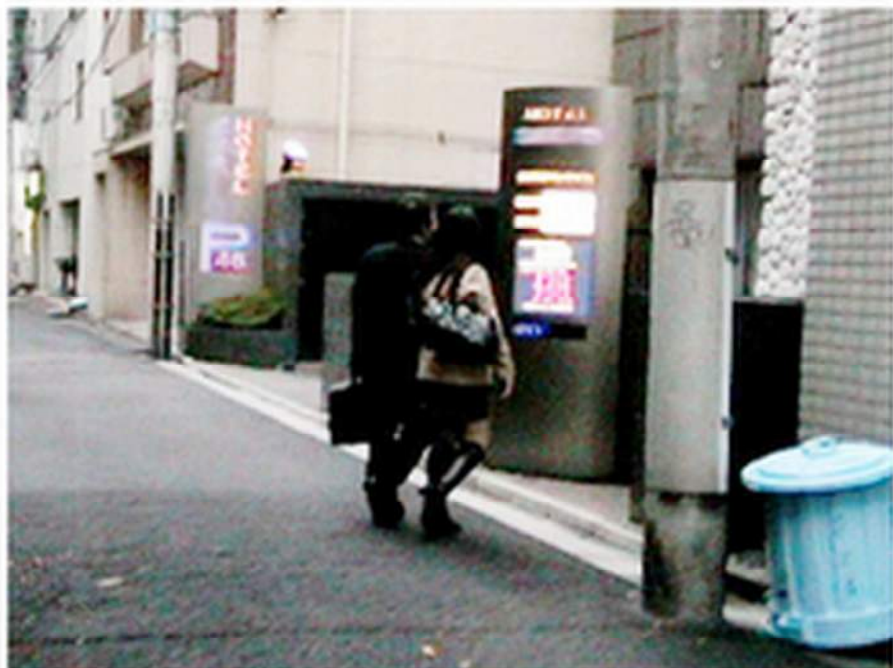
< ホテルに入る2人 >