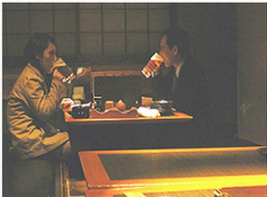
< 店内で飲食する2人 >